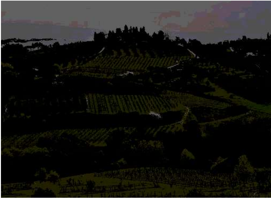
(Veduta delle colline del Chianti)

Il suo territorio è prevalentemente collinare: le colline principali sono le Metallifere e il Chianti . Fanno parte della regione anche le isole dell' Arcipelago Toscano .