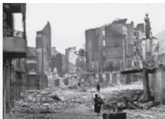
La città di Guernica dopo i bombardamenti nazifascisti.

L'avvenimento fu considerato dai repubblicani una prova della barbarie nazifascista e si decise di commissionare al più grande artista spagnolo dell'epoca, Pablo Picasso, un'opera che raccontasse al mondo la tragedia di Guernica. In pochi mesi Picasso realizzò un quadro enorme, alto circa tre metri e mezzo e largo quasi otto metri, considerato uno dei capolavori dell'arte del Novecento. Il dipinto è in bianco e nero perché secondo Picasso la guerra non può avere colori. L'opera non fu esposta in Spagna fino al 1982: Picasso infatti non volle che tornasse in patria finché non fosse caduto il franchismo.