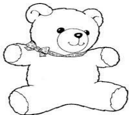
A BROWN TEDDY BEAR