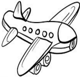
A GREEN PLANE