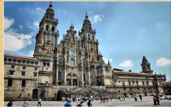
Santiago de Compostela