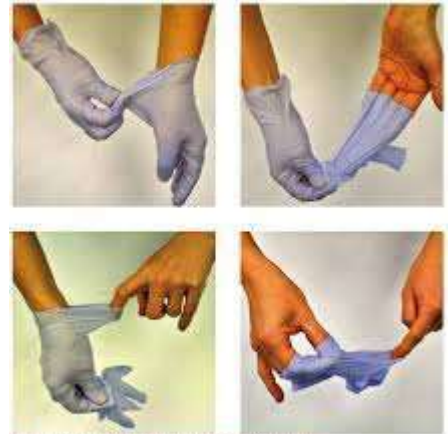
Figure 12.5. Tecnica di rimozione dei guanti.